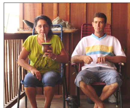
Funcionários da Krombauer trazem para o mocambo do Pacoval o exótico hábito do chimarrão típico do Sul do País.

Não se afirma que esse seja o caso específico da Krombauer, mas é certo que os jornais de Belém noticiaram à farta a existência de um