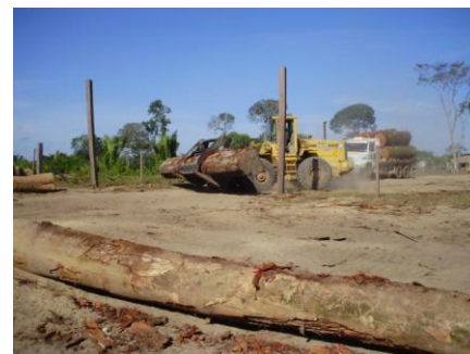
Maquinário da madeireira Krombauer em plena ação na reserva extrativista do mocambo do Pacoval . Para o município de Alenquer só ficam os problemas e nenhum benefício.