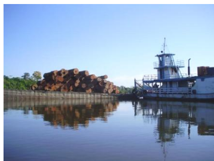
Balsa da Krombauer carregada de madeira de lei extraída no mocambo do Pacoval .

Tangida do município de Novo Progresso, há alguns anos atrás, quando os órgãos ambientais passaram a usar de um maior rigor na fiscalização de projetos de manejo florestal, a empresa de origem sulista Comércio de Madeiras e Laminados Krombauer Ltda. instalou-se numa extensa área de quase 7.500 hectares de floresta nativa, distante apenas 1 km do núcleo urbano da vila de Pacoval em Alenquer, de onde já extraiu milhares de metros cúbicos de madeira de lei, em especial a maçaranduba.